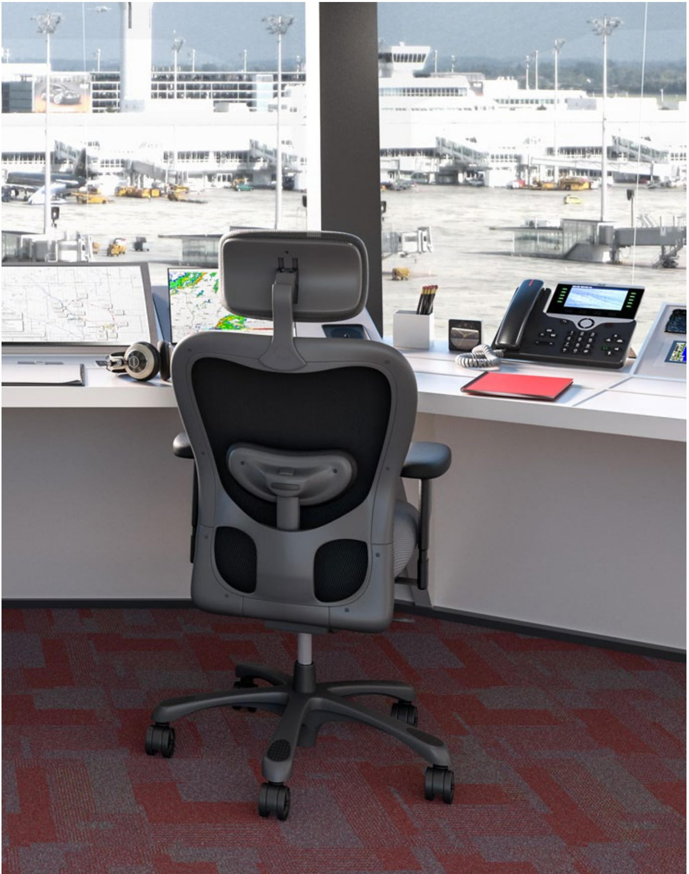
CXO 6200ti Collection Stretch (Sand)