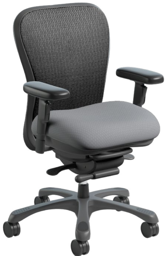
6200-TI COLLECTION STRETCH BEEHAVE | BEE10 | Slate