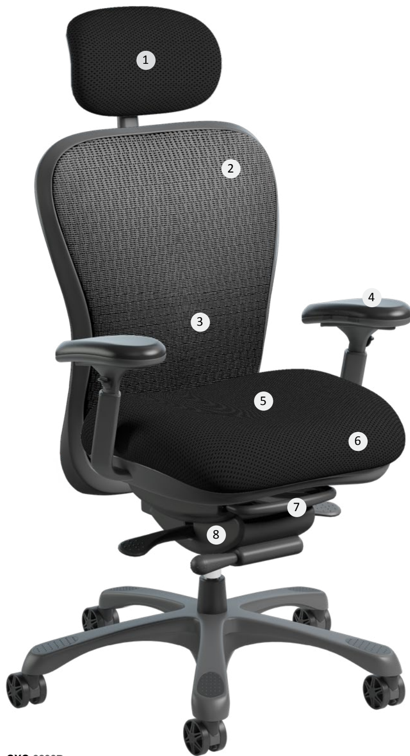
CXO 6200D Collection Stretch (Noir)