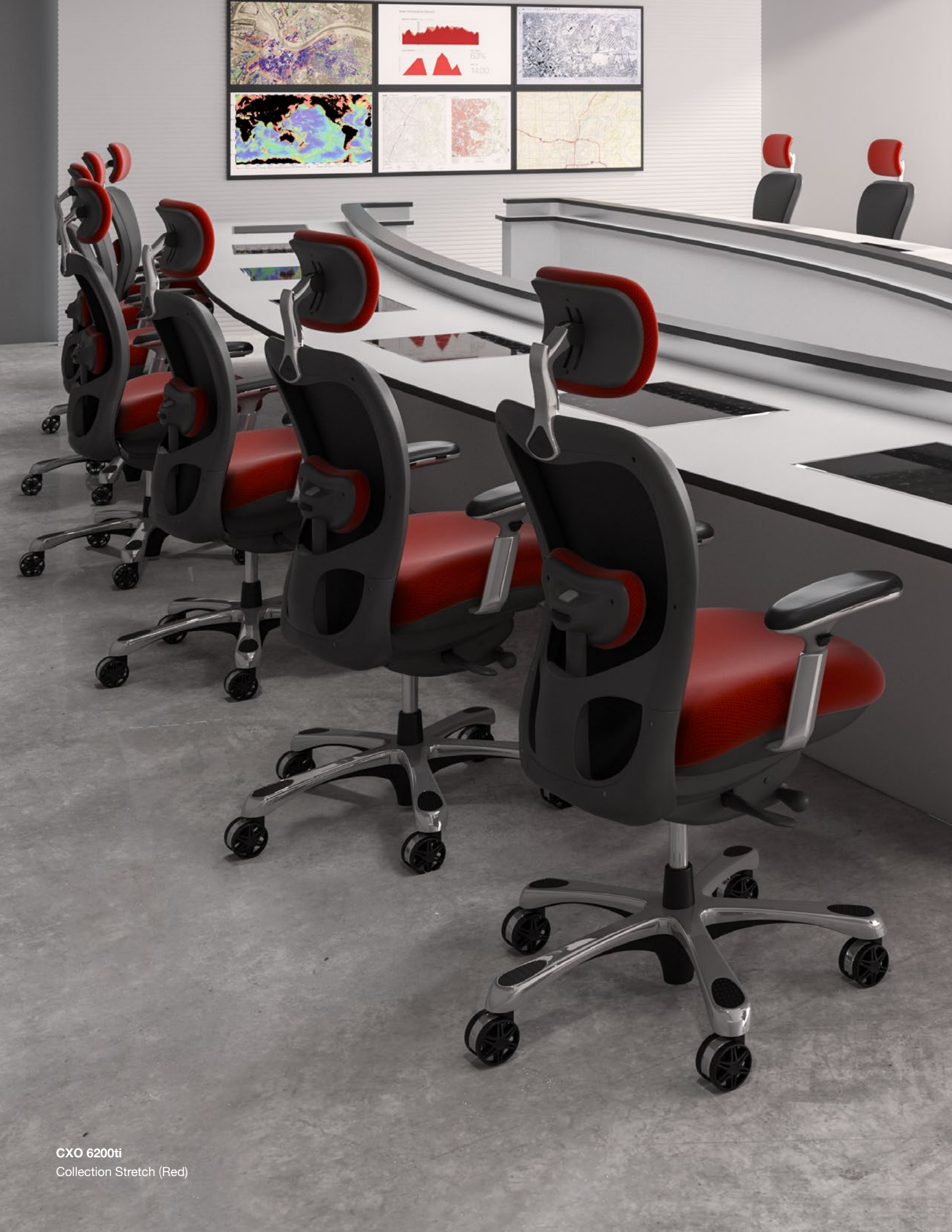
CXO 6200ti Collection Stretch (Red)