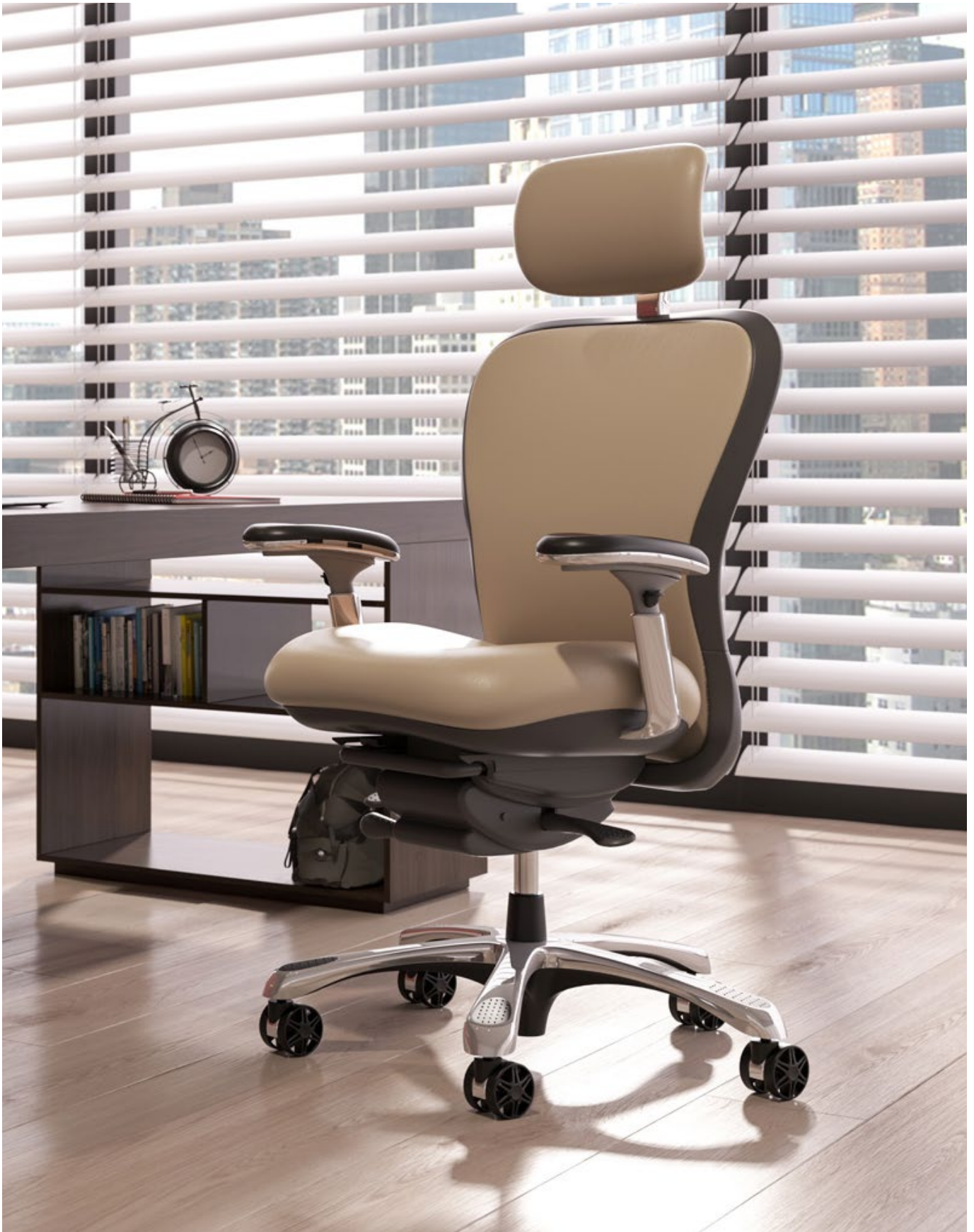
CXO L6200 Cuir Princesse (Sand)