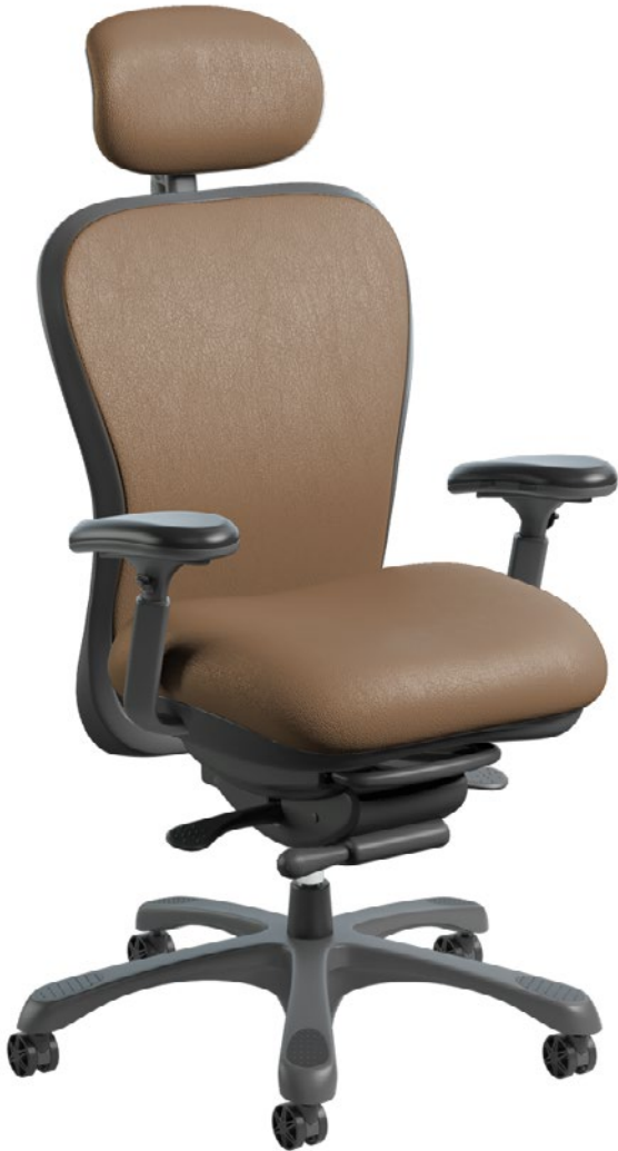
L6200D COLLECTION CUIR PRINCESS | 185 | Almond