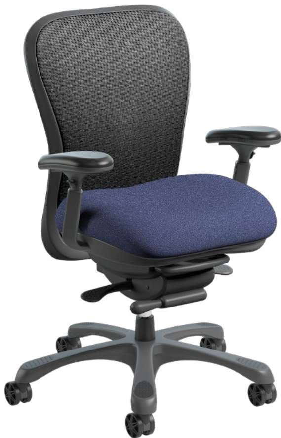
6200 COLLECTION STRETCH MERIDIAN | MER002 | Monarch Blue

Le CXO™ peut être recouvert de nos textiles, vinyls ou cuirs de haute qualité. Personnalisez votre chaise avec notre large gamme de couleurs et de nuances sur My Chair Maker: nightingalechairs.com/my-chair-maker