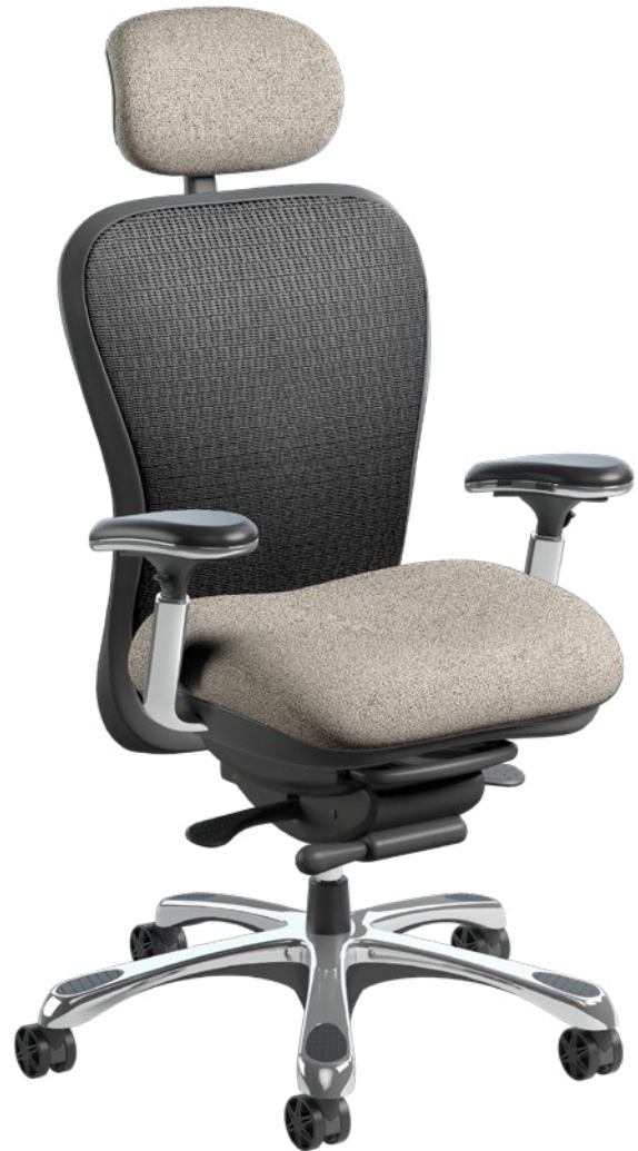
6200D-CH COLLECTION STRETCH MERIDIAN | MER007 | Cappuccino