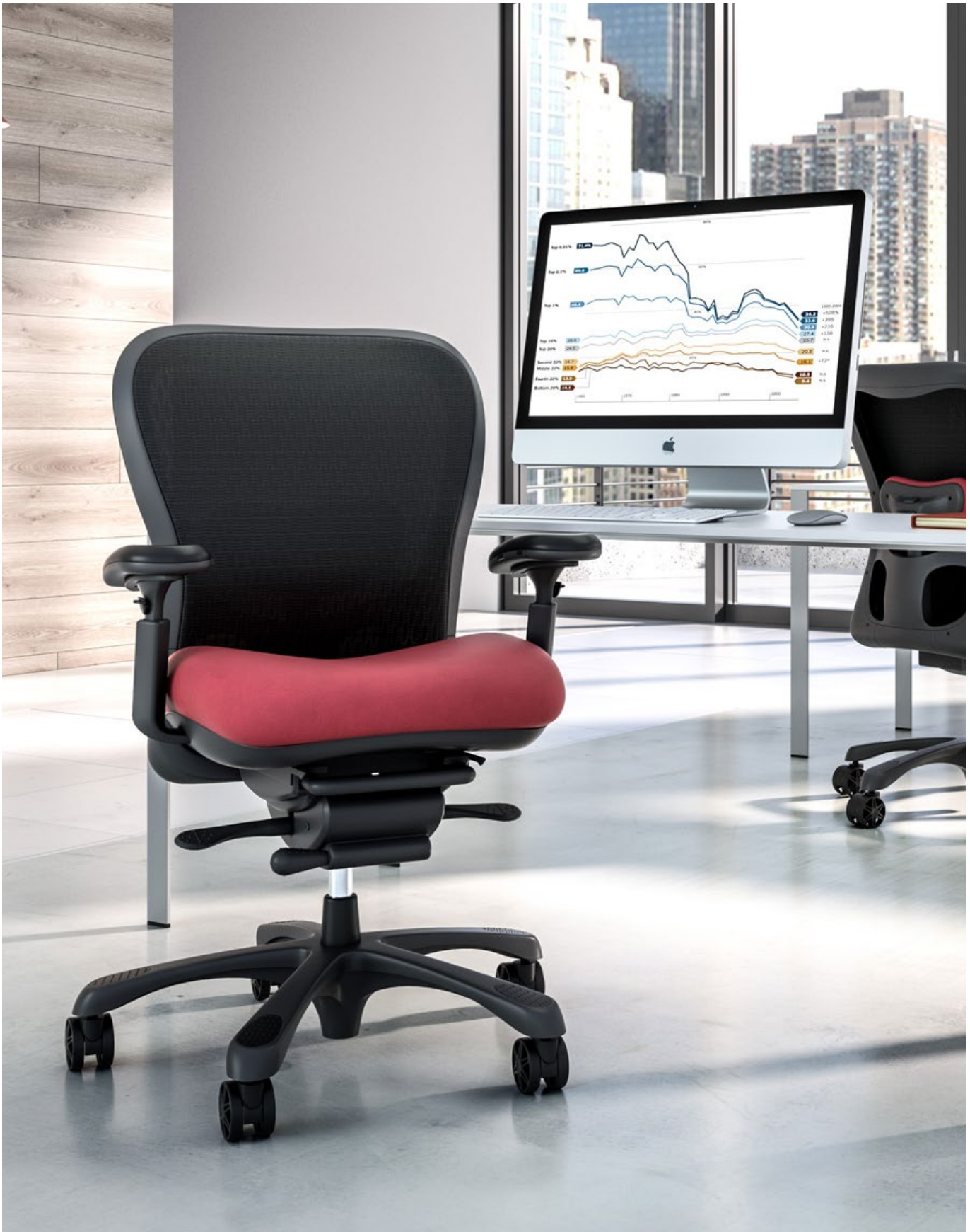
CXO 6200 Collection Stretch (Flare)