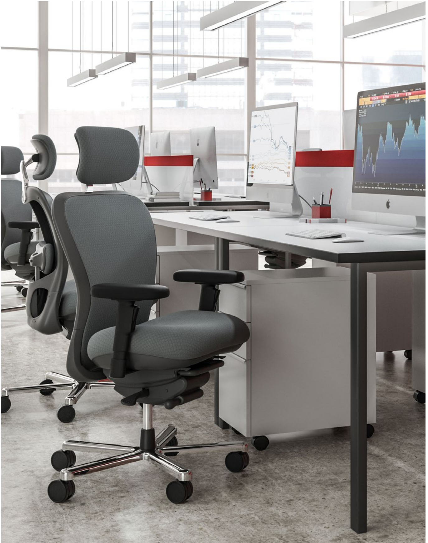
CXO 6200hd Collection Stretch (Slate)